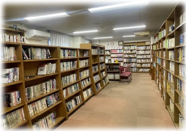
👉 図書室の様子 👈

また、児童・幼児向けの本も充実しており、お子さんが楽しめる絵本や読み聞かせにもぴったりの本がたくさんあります。