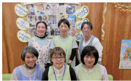
子育て支援スタッフ