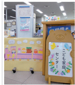
役場健康こども課窓口