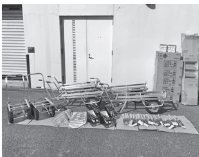
アークランズ株式会社 様 寄附金額 非公表（物納） 寄附事業 町民の幸せな生活を支える コミュニティの創造事業