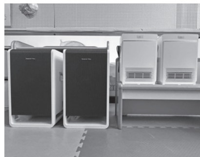
ダイニチ工業株式会社 様 寄附金額 137,200円（相当額・物納） 寄附事業 「長瀬で出会い、長瀬で育てる」 若年層への支援事業