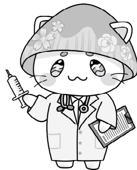
長瀬町公式マスコットキャラクター とろにゃん