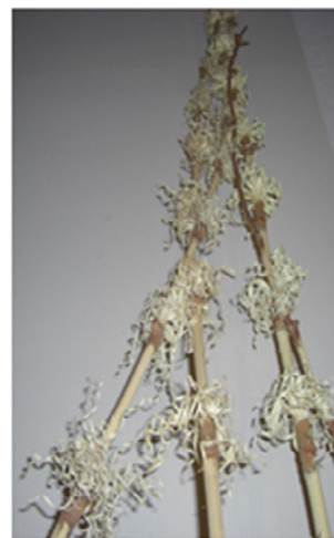
【 削り花 】