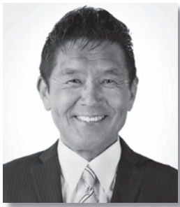
長瀬町長 鈴木 日出男