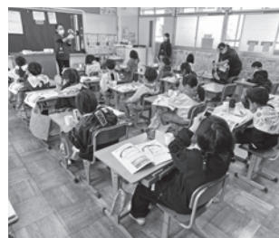
高砂保育園 11月11日(火)