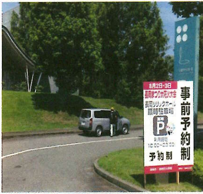
長岡花火 公式駐車場