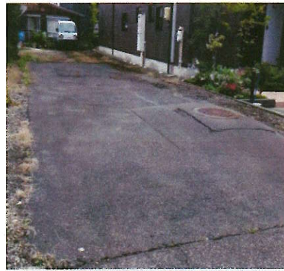
利根川花火 徒歩15分 5,000円/1台