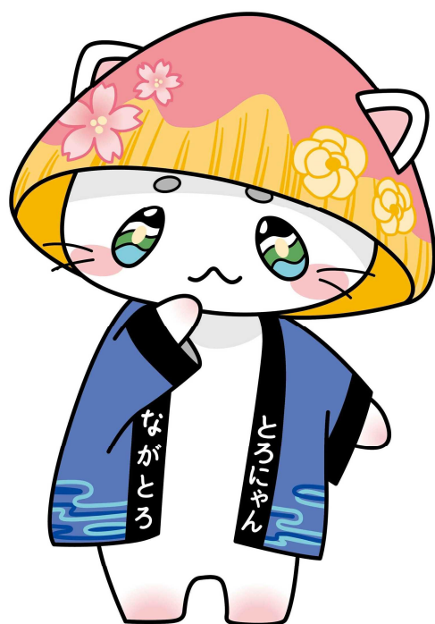
長瀬町公式マスコットキャラクター とろにゃん