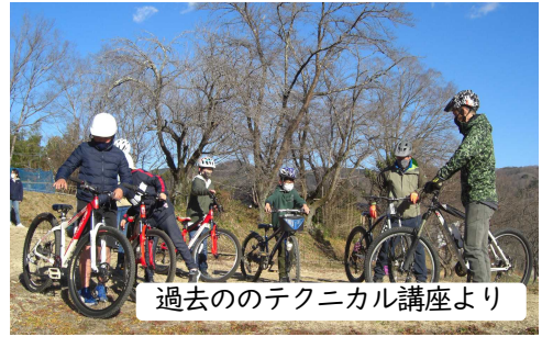
過去のテクニカル講座より