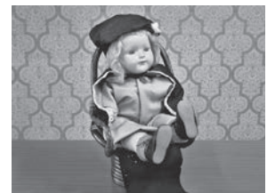
長瀬第一小学校の青い目の人形

長瀬第一小学校の人形はエファンビー・ローズ・メリー、長瀬第二小学校の人形はメリー・エリザベット・フレイマーと呼ばれ、それぞれの校舎で大切に保管されています。