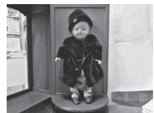
長瀬第二小学校の青い目の人形