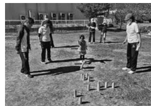
◀前回の教室の様子