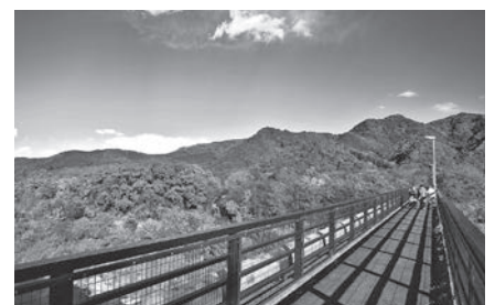
金石水管橋