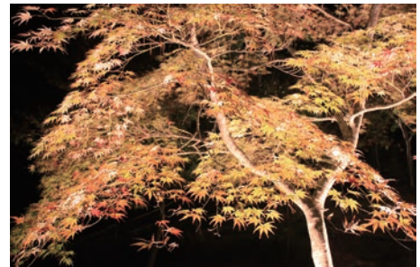
月の石もみじ公園