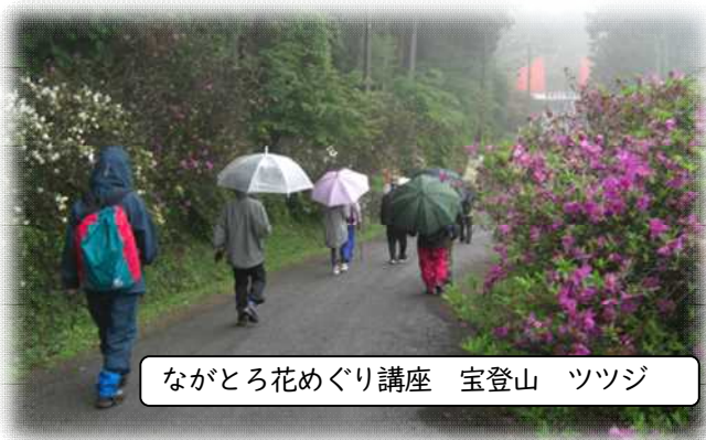
ながとろ花めぐり講座 宝登山 ツツジ