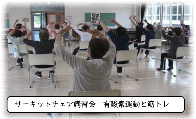
サーキットチェア講習会 有酸素運動と筋トレ