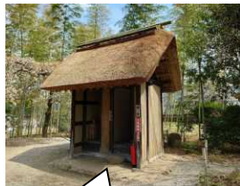
葺き替えたての 麦藁屋根(側)