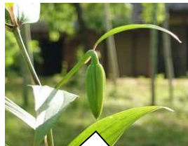
裏の竹林ではヤマユリの 蕾が膨らみ始めています