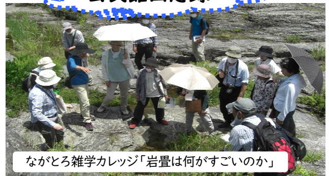
ながとろ雑学カレッジ「岩畳は何がすごいのか」