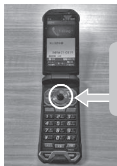
携帯電話（ガラケー）