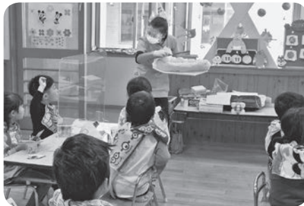
高砂保育園 11月11日(金)