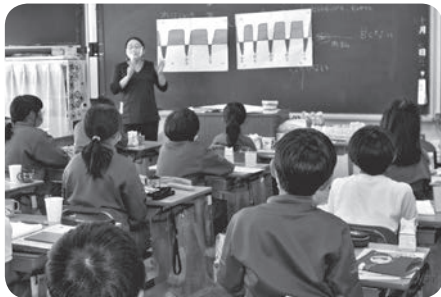
第一小学校 11月8日(火)

また、児童からは、「一生つかう歯をしっかりと磨きたい。」「これからも歯磨きをして大人まで歯を大切にしたい。」「だらだらと食べないようにする。」などの感想がありました。