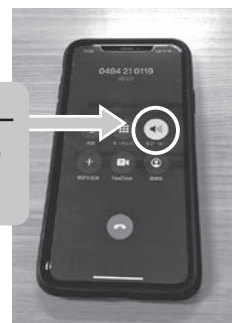
携帯電話（スマートフォン）