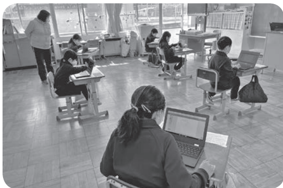
・タブレットを活用した授業風景（長瀬第二小学校）