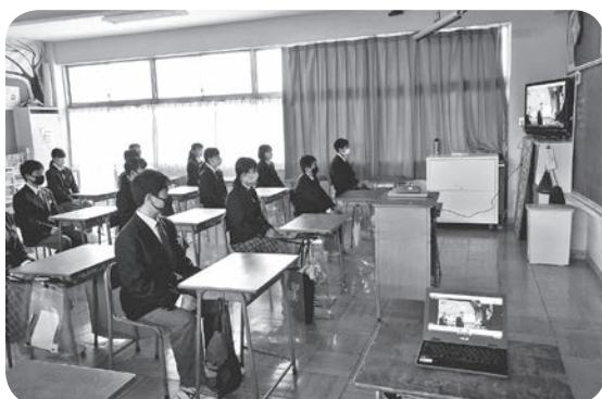
・リモートで行った卒業式の様子（長瀬中学校）

3月13日(土)に執り行われた長瀬中学校卒業式では、整備したタブレットを活用し、新型コロナウイルス感染症対策のため、式場に入れなかった在校生たちは、各教室内のモニターに映し出された卒業式の様子を自席で見ながら、卒業生たちに感謝の気持ちを込め、温かい拍手を送っていました。