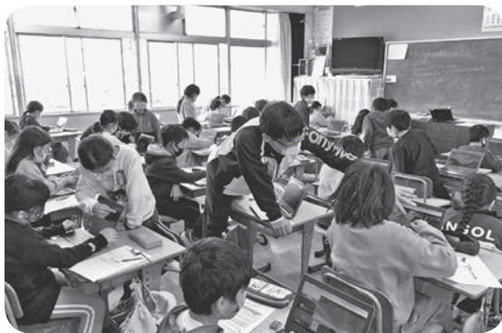
・タブレットを活用した授業風景（長瀬第一小学校）

各学校ではタブレット端末を活用し、新しい試みを行っていますので、その様子を紹介します。