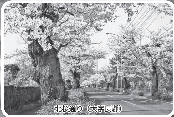
北桜通り (大字長瀬)

「日本さくら名所100選」にも選ばれている長瀬の桜。今年も町内各所で美しい花を咲かせていました。