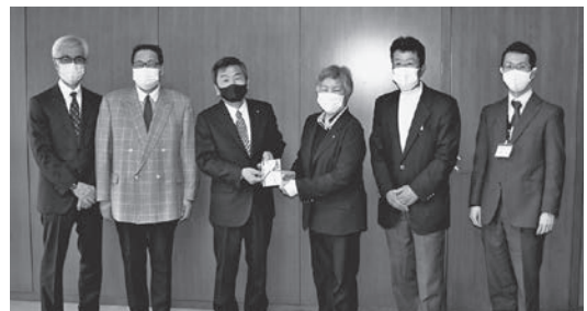
左から一般社団法人秩父法人会秩北支部 中副支部長、中野副支部長、福島支部長、大澤町長、大澤副支部長、大衆企画財政課長