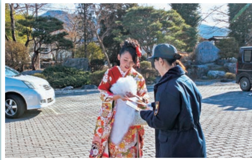
↑ 岩畳での演習の様子