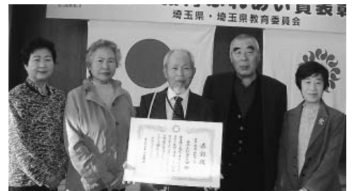
長瀬ふれあいの会