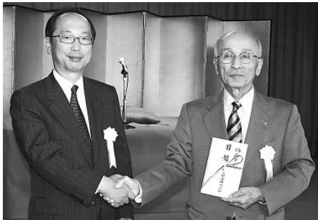
(左から大谷社長、大澤町長)

秩父鉄道株式会社から長瀬駅開業100周年記念チャリティ寄席開催に伴う寄附として、現金100万円をいただきました。【10月11日】